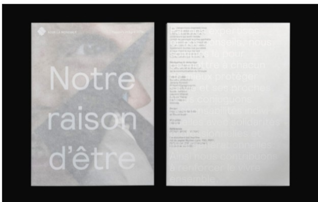
Rapport annuel d'AG2R La Mondiale par Élodie Boyer Conseil

→ Voir le palmarès complet de la 52ème édition du Club des DA