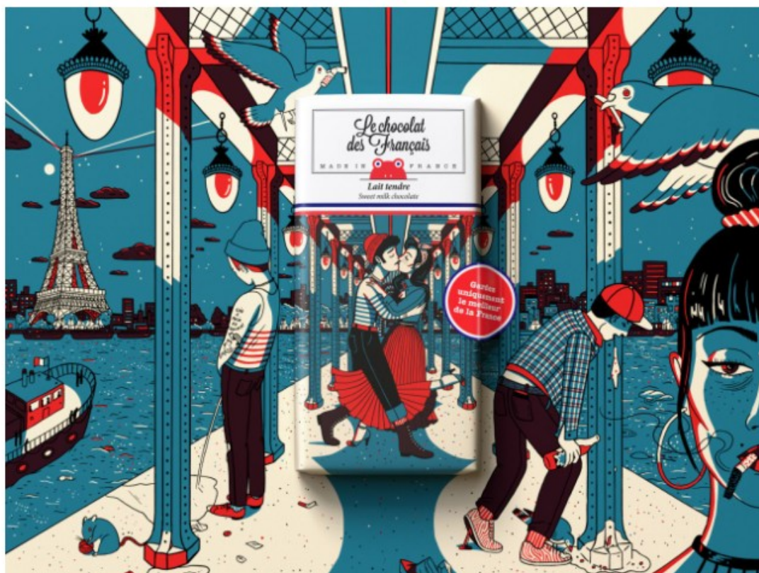
Affiche pour la campagne «Ne gardez que le meilleur de la France» par Benjamin Marchal et Faustin Claverie (TBWA\Paris)

Parmi les lauréats, certains créatifs ont été particulièrement remarquables. C'est notamment le cas de Benjamin Marchal et Faustin Claverie , co-directeurs de création pour l'agence TBWA\Paris, qui remportent 18 prix. Le prix de l'annonceur de l'année a quant à lui été décerné à Burger King et le prix étudiants aux élèves de l'école Efet Studio Créa.