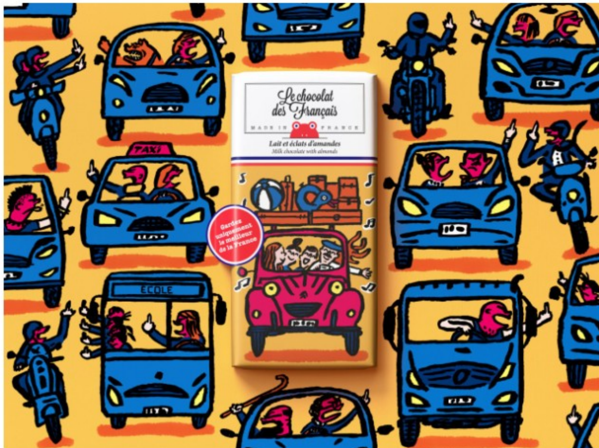
Illustration pour la campagne «Ne gardez que le meilleur de la France» par Benjamin Marchal et Faustin Clavierie (TBWA\Paris)